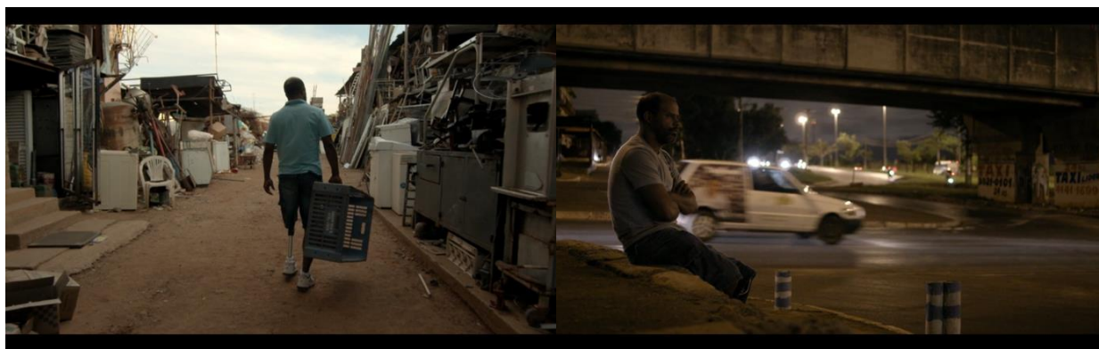
Figuras 7 y 8: Sartana pasa sus días recolectando prótesis de la basura o en actitud contemplativa, a la espera de escuchar o ver algo que viene de otra dimensión o tiempo. Su relación con los objetos encontrados y el dibujo lo vinculan a la figura benjaminiana del trapero, un historiador a contrapelo que encuentra en los descartes fragmentos imantados de historia. Hacia el final del film su melancolía se vuelve un "melancolizar", una cartografía afectiva de toda la periferia. Fotogramas de Branco Sai, Preto Fica.