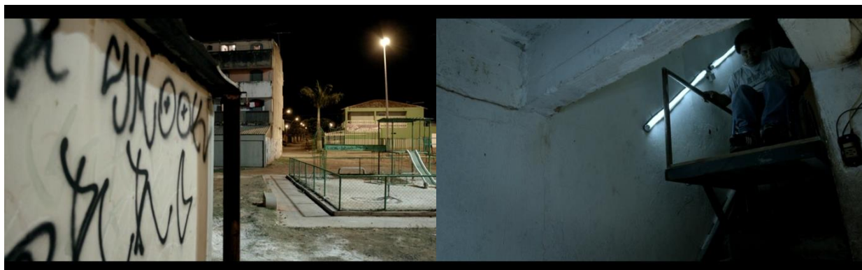
Figuras 1 y 2: Los espacios abiertos y cerrados, oscuros y precarios, ponen en evidencia las dificultades de movilidad de los personajes. Fotogramas de Branco Sai, Preto Fica.

no tenemos seguridad sobre un nuevo comienzo pero es claro que la catástrofe final contrarresta la narrativa del progreso porque para Marquim ya no se trata de rescatar un pasado, revivir recuerdos, reproducirlos en la radio, sino actuar en el presente ante la imposibilidad del futuro. Destruir Brasilia, a través de la ficción y mediante una bomba cultural polifónica reafirma la construcción del propio discurso de la periferia. Como el ángel benjaminiano la mirada de Cravalanças niega la marcha al progreso por la contundente acumulación de las ruinas en las que quizás, un nuevo ejercicio de escucha, productivamente anacrónico, pueda encontrar que todavía "ecoa noite e dia o canto do trabalhador". En este sentido los procedimientos de fabulación y memoria de BSPF convierten a las imágenes y sonidos en huellas de una relación con el pasado cuyo "efecto de archivo" se define por el desplazamiento de la autoridad de las cronologías a la performatividad de la experiencia y el afecto. Esto conlleva asumir una temporalidad relativa cuya recepción está cargada de un "afecto de archivo", una intensidad nueva que parte de la disparidad, la diferencia y la contingencia (Baron, 2014). De este modo, BSPF interviene activamente en los archivos desordenando y rearticulando sus límites, redistribuyendo agenciamientos, alterando temporalidades, redireccionando los efectos y afectos que estos producen.