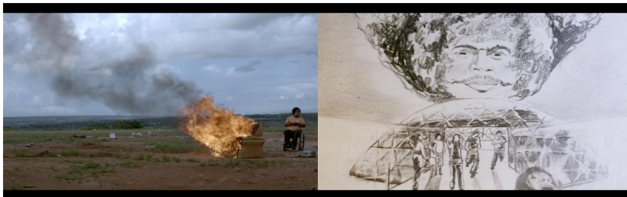
Figuras 11 y 12: "Melancolizar" y agenciar el odio suponen intervenir disruptivamente en la temporalidad: incendiar los deseos y las memorias del pasado e imaginar la anulación de todo futuro. Fotogramas de Branco Sai, Preto Fica .